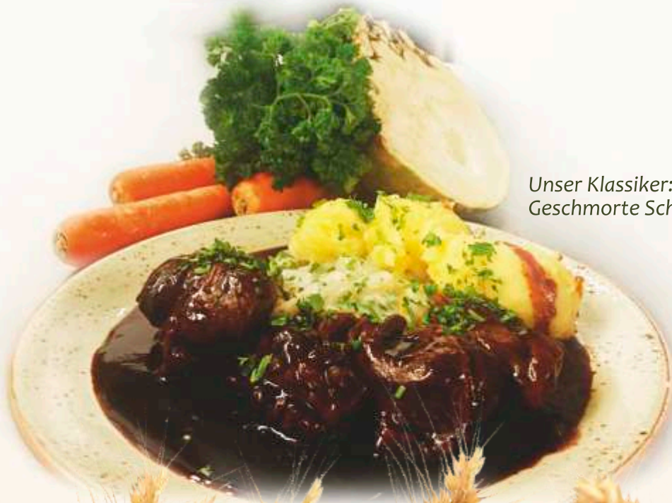
Unser Klassiker: Geschmorte Schweinebäckchen